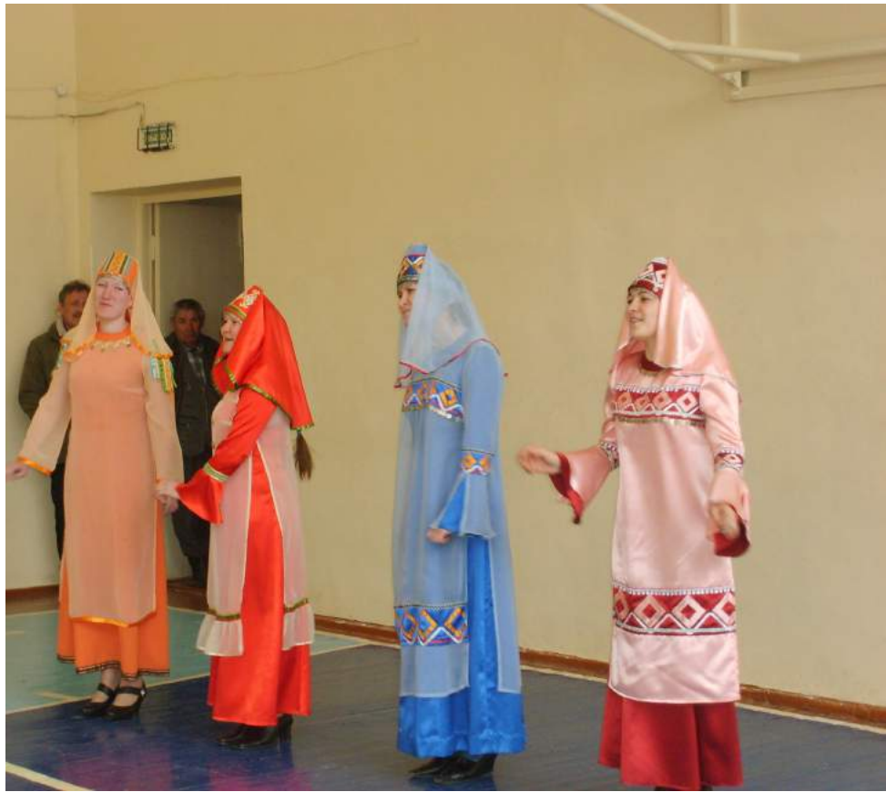
Спортсменов приветствует ансамбль удмуртской песни