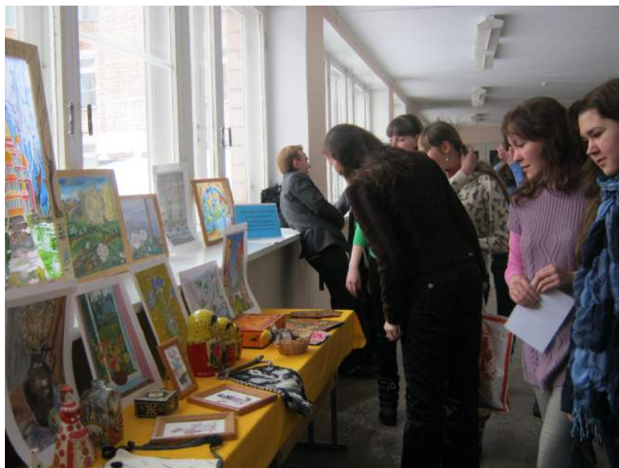
Выставка творческих работ студентов УРСПК